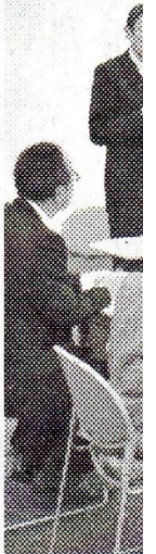
教 育 水 市 総 合