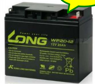
電気を貯める バッテリー (蓄電池)