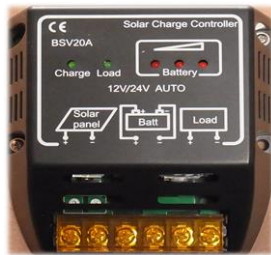
電圧の変動を管理する コントローラー (20A) *バッテリー残量 インジケーター付