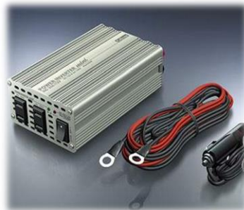
直流を交流に変える インバーター