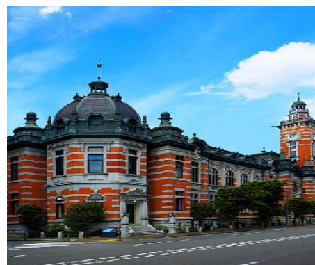
横浜市開港記念会館 (横浜の代表的建造物)