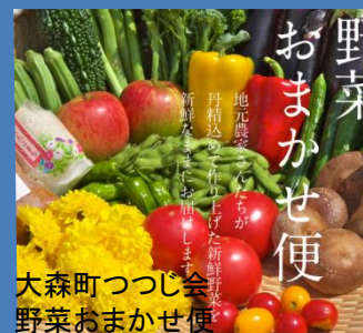
野菜 おまかせ便 地元農産物を使った新鮮野菜が丹精込めにお届けした新鮮野菜のおまかせ便 大森町つつじ会 野菜おまかせ便