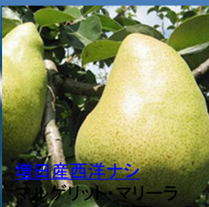
埴田産西洋ナシ マリンゲット、マリーラ