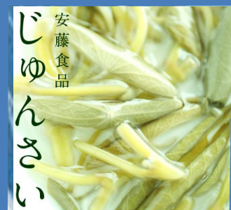
安藤食品 じゅんさい

4月5日 東京説明会 会場【クリエクロス神田/千代田区鍛冶町2-3-2神田センタービル6F】