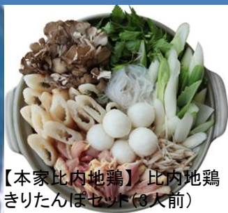
【本家比内地鶏】比内地鶏きりたんぼセット(8人前)