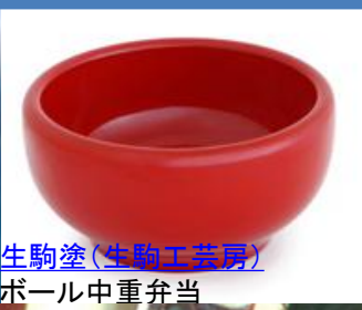
生駒塗(生駒工芸房)ボール中重弁当