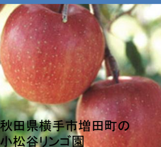
秋田県横手市増田町の小松谷リンゴ園