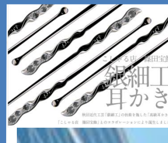
この素晴らしい銀細工耳かき 秋田県大館市「銀細工」の技術を受け継いだ高麗耳かき 【こしや商店 高麗耳かき】のこだわりをぜひ味わってください