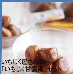
いちじく屋さんの「いちじく甘露煮」セット