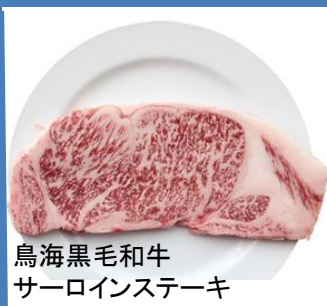
鳥海黒毛和牛サーロインステーキ