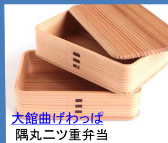
大館曲げわっぱ 隅丸二ツ重弁当