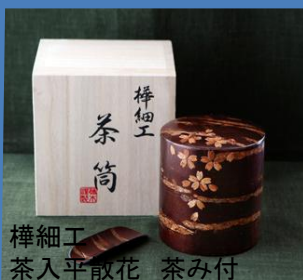
樺細工 茶入平散花 茶み付