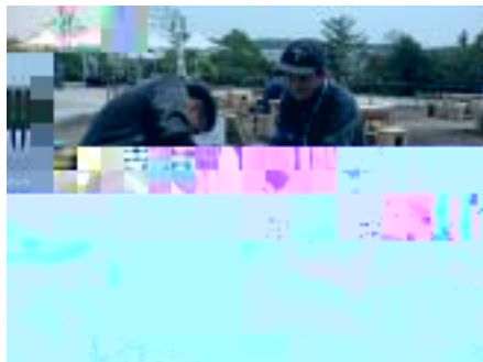
「太陽光発電でドン」人力 vsPV