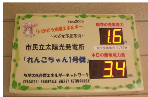
茅ヶ崎市民立太陽光発電所の発電表示装置