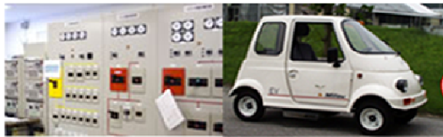
需要地系統ハイブリッド 実験設備