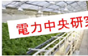
電中研式野菜工場