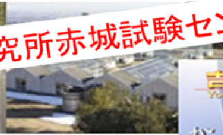
ガス接触試験設備